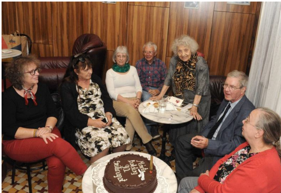
A meleg baráti hangulatú rendezvény résztvevői az ünnepi tortával.