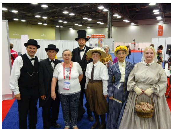
Történelmi arcképcsarnok a kiállításon