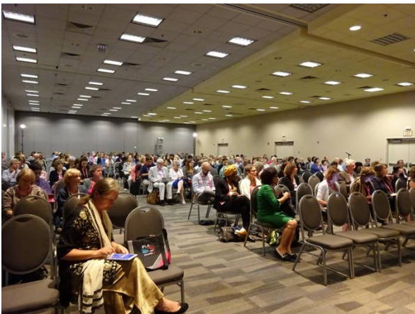
A Tudásmenedzsment Szekció programja

A konferencia kiemelkedő eseményei voltak a reggelenként megszervezett plenáris ülések, ahol az USA könyvtárainak, kultúrájának legfontosabb mozzanataiba pillanthattunk be.