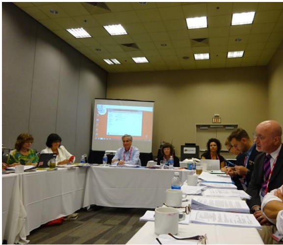
IFLA GB ülése. Tárgyalás a Gates Alapítvány képviselőivel