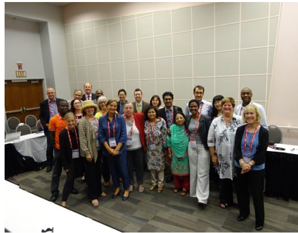
Az IFLA Tudásmenedzsment Szekciójának állandó bizottsága

A konferencia kiemelkedő eseményei voltak a reggelenként megszervezett plenáris ülések, ahol az USA könyvtárainak, kultúrájának legfontosabb mozzanataiba pillanthattunk be.