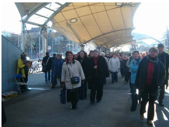
A BÉCSI KÖZPONTI VÁROSI KÖNYVTÁR ELŐTT