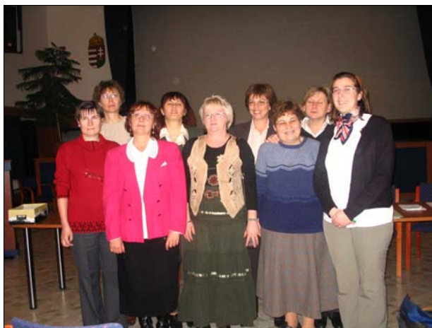
AZ EGYESÜLET JELENLEGI VEZETŐSÉGÉNEK TAGJAI