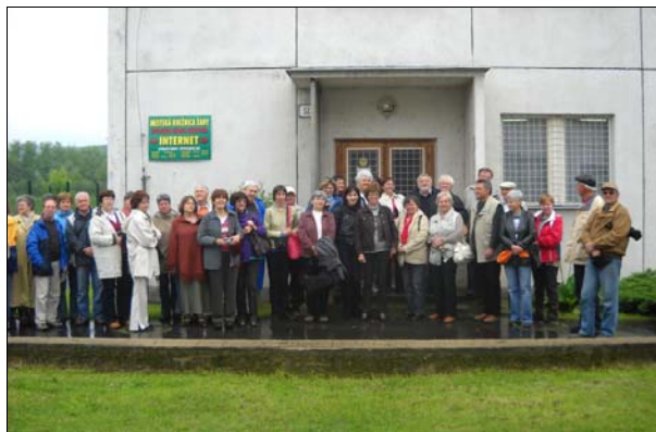
AZ IPOLYSÁGI KÖNYVTÁR ELŐTT

http://www.mke.oszk.hu/Szervezetek/VeszprémMegyeiSzervezet