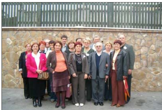
HATÁRON TÚLI MAGYAR KOLLÉGÁKKAL, 2007-BEN