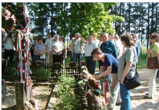
TAMÁSI ÁRON SÍRJÁNAK MEGKOSZORÚZÁSA