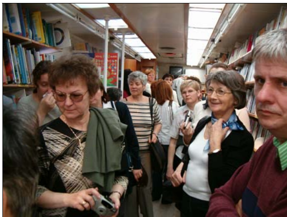
A MURASZOMBATI BIBLIOBUSZON

Látogatás a bécsi központi könyvtárban (Hauptbücherei Wienben) és az Albertinában.