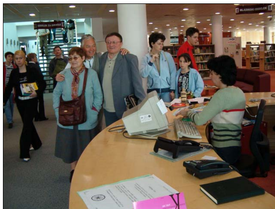
A RÉGI ELNÖKÖK A MURASZOMBATI KÖNYVTÁRBAN