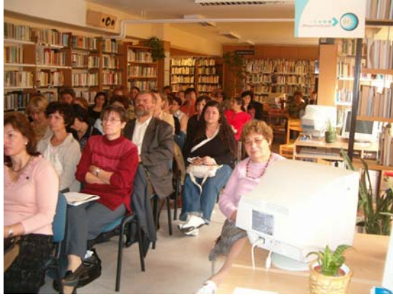
SZAKMAI NAP TAPOLCÁN