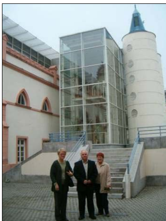
VAJDASÁGI KÖNYVTÁROSOK A MEGYEI KÖNYVTÁRBAN