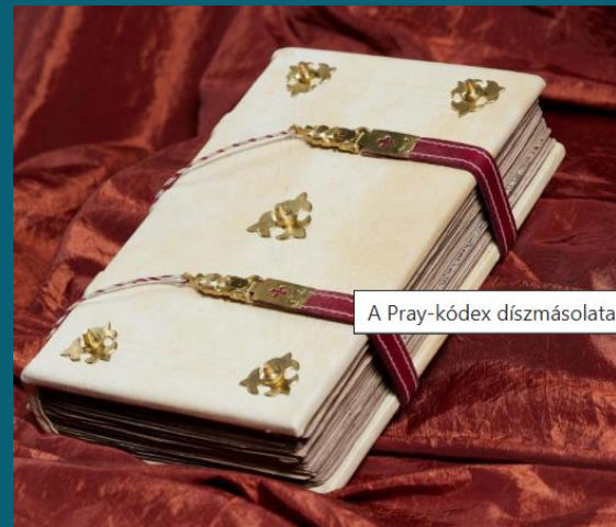
A Pray-kódex díszmásolata