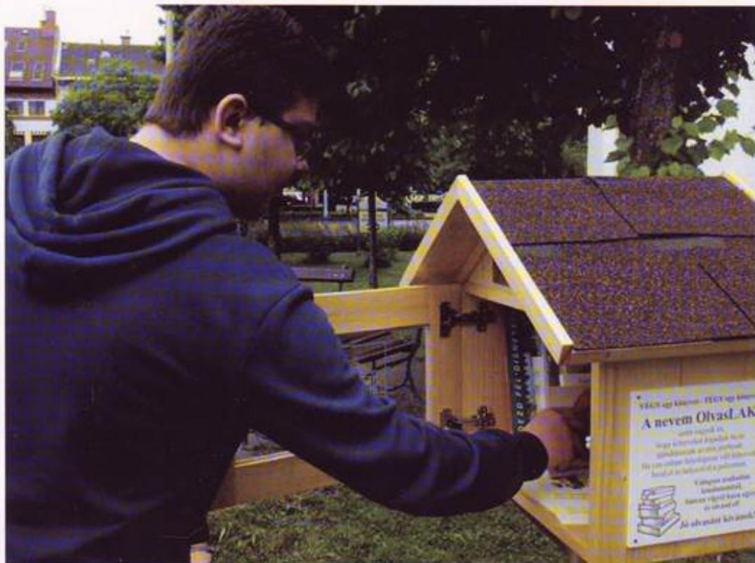
Végy egyet, tégy egyet! Az egyik OlvasLAK Kiskunfélegyházán

Az Informatikai és Könyvtári Szövetség hír- és levelezőlapja